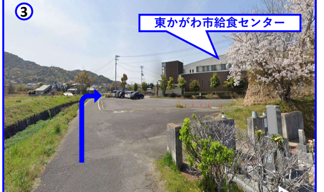
③ 東かがわ市給食センターの隣になります。