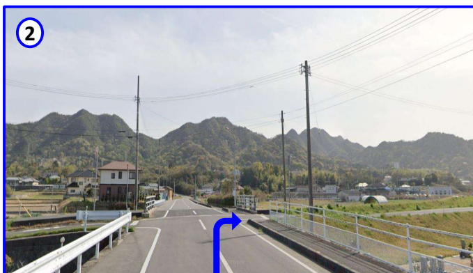
② 道なりに進み、橋の手前で右折します。