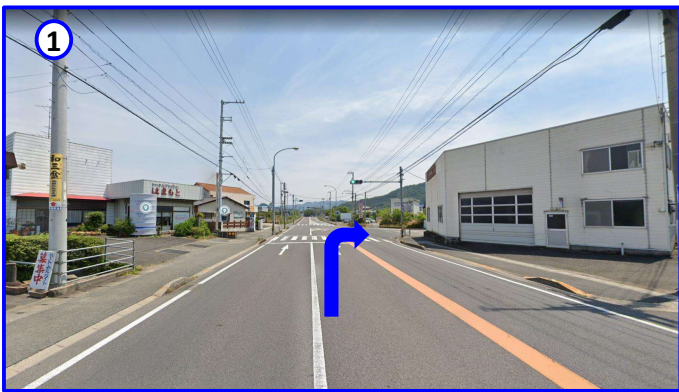
① 県立白鳥病院から東へ進み二つ目の信号を右折します。