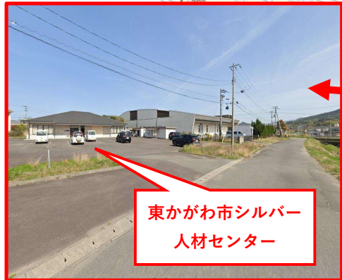
東かがわ市シルバー人材センター